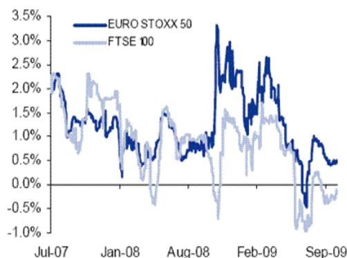
Croissance implicite des dividendes 2010-2018

Source: Goldman Sachs Global ECS Research.